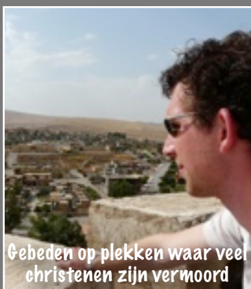
Gebeden op plekken waar veel christenen zijn vermoord

wat doe je met je geloof als dat je enige houvast is, maar ook de reden is van jou vervolging. (vraag van veel vervolgte christenen)