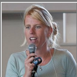
spreken in Engeland

handelingen 26,15b-18 om hun de ogen te openen, zodat ze zich van de duisternis naar het licht keren, en van de macht van Satan naar God. Door het geloof in mij zullen ze vergeving krijgen voor hun zonden, en samen met allen die mij toebehoren zullen ze deel krijgen aan mijn koninkrijk."